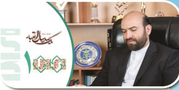
مردم عزیز و ذینفعان نظام استاندارد همکاران محترم سازمان ملی استاندارد ایران باسلام و تهنیت

دکتر مهدی اسلام پناه، رییس سازمان ملی استاندارد ایران در پیامی، روز جهانی استاندارد، آغاز هفته استاندارد و یکصدسالگی تاسیس این سازمان را به مردم عزیز، ذینفعان نظام استاندارد و همه همکاران سازمان ملی استاندارد ایران در سراسر کشور تبریک و تهنیت گفت. متن کامل پیام به شرح زیر است: